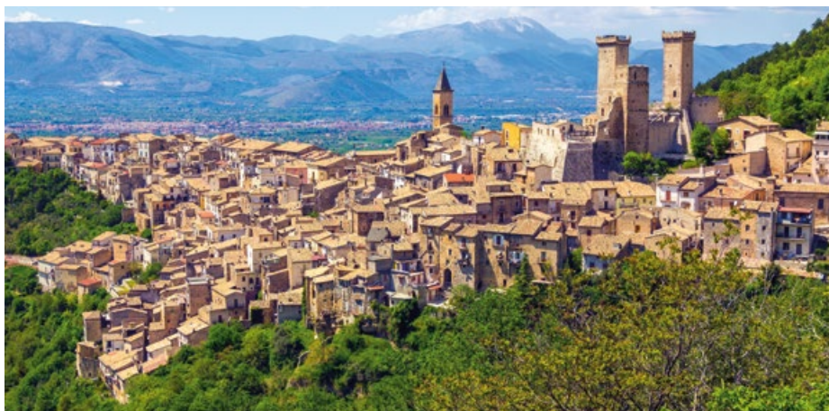
Pacentro gilt als eine der schönsten Städte Italiens