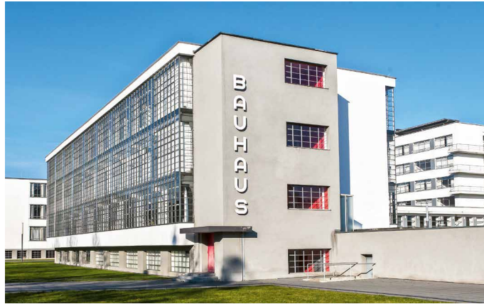
Bauhaus-Museum in Dessau