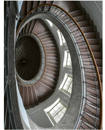
Treppe im Bauhaus Weimar

Das 1919 von Walter Gropius und Henry van de Velde gegründete Bauhaus in Weimar markiert mit der Zusammenführung von Kunst und Handwerk einen Paradigmenwechsel auf den Gebieten von Architektur, Kunst, Theater, Lebensgestaltung und Design. 1925 verlegte das Bauhaus seinen Sitz nach Dessau, wo es 1933 durch die Nationalsozialisten geschlossen wurde. Die neuen, dem Thema gewidmeten Museen in Weimar und Dessau bieten Einsicht in die Reform der Kunstausbildung. Deren Anspruch, Architektur als Gesamtkunstwerk mit den anderen Künsten zu verbinden, wirkt bis in die Gegenwart. Mit der Gleichbehandlung der Geschlechter wurde das Bauhaus zur Talentschmiede einer höchst kreativen Generation von Kunstschaffenden von hoher Diversität. In das Thema einbezogen wird auch das Davor und Danach.