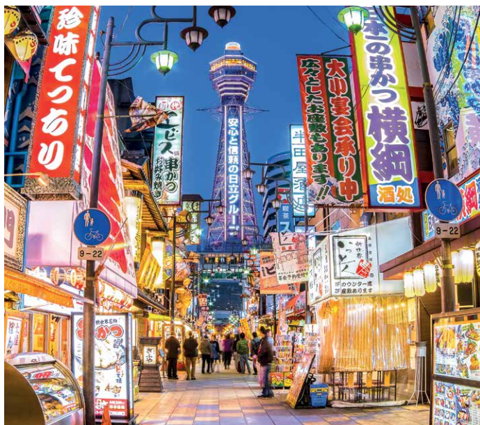
Aussicht auf den Tsutenkaku-Tower in Osaka