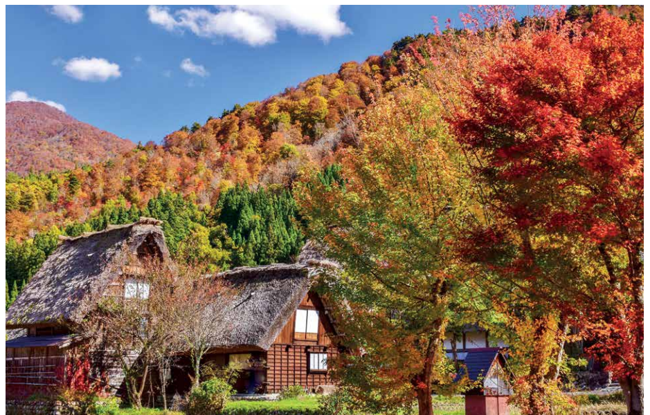
Herbststimmung in den japanischen Alpen bei Shirakawa-go

Zwei volle Tage widmen wir uns dem reichen kulturellen Erbe der ehemaligen Kaiserstadt. Wir werden uns für die Entdeckungen Zeit und Musse lassen und dabei einige der bekanntesten kulturellen Schätze Japans kennenlernen. Unter anderem besuchen wir den goldenen Tempel Kinkaku-ji, lassen den unergründlichen Zen-Garten des Ryoan-ji auf uns wirken und wandeln durch den Nachtigallen-Flur der Burg Nijo-jo. Zudem gibt es etwas Freiraum für Entdeckungen und Einkäufe in Eigenregie.