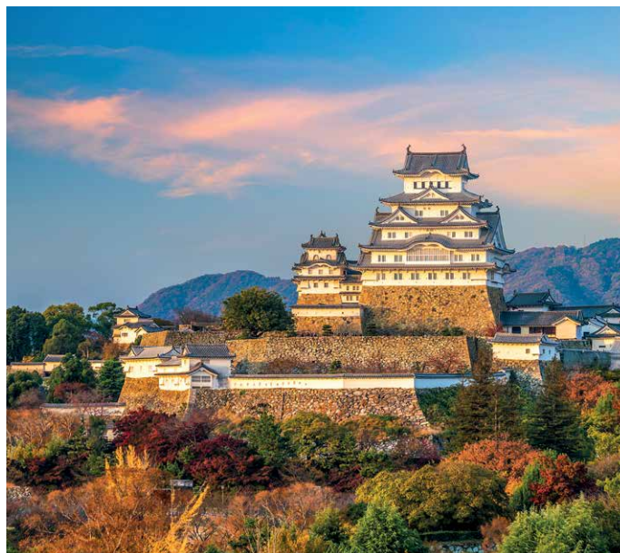
Die Festung Himeji