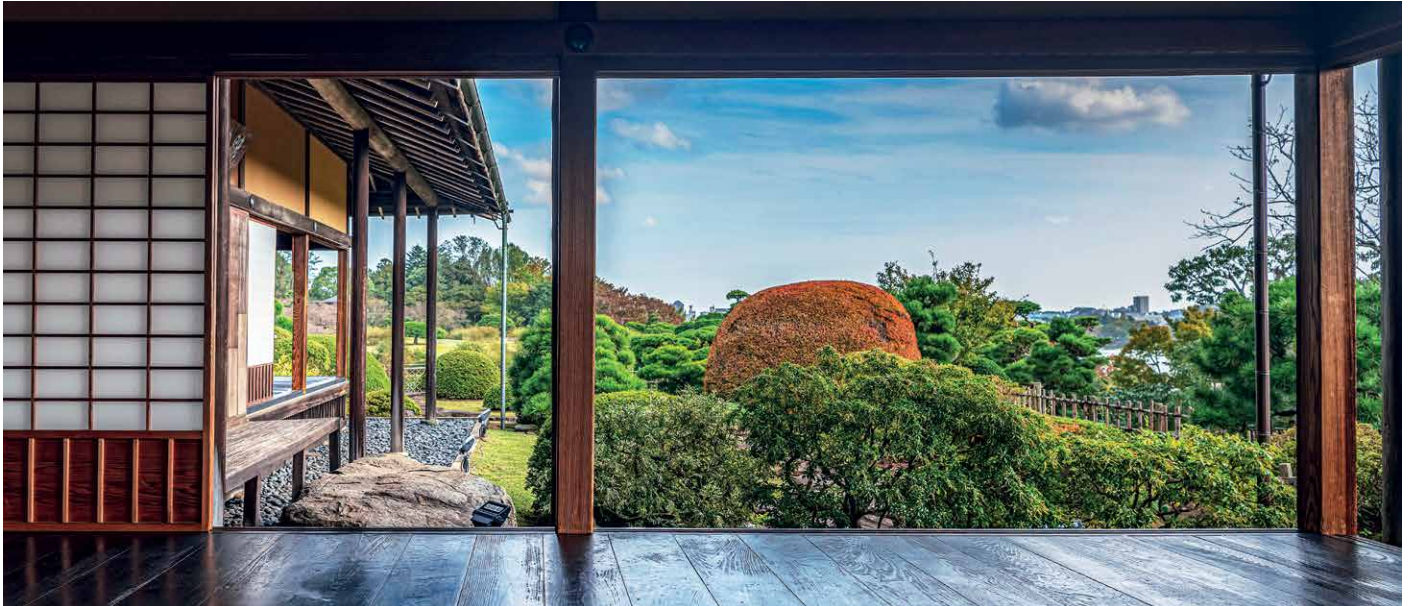
Blick in den Garten Kairaku-en in Mito

Japan hat die Vorstellungen der Europäer seit langem beflügelt – und die Ergebnisse reichten von Romantisierung bis Dämonisierung. Nach Jahrhunderten der bewussten Abschottung wurde der Inselstaat Mitte des 19. Jhs. gezwungen, sich zu öffnen. Was dann folgte, war ein beispielloser Reformschub. Anhand von Kunst, Alltagskultur und historischen Stätten erschliessen wir uns die Geschichte und die aktuelle und vielschichtige Auseinandersetzung mit dieser im Japan von heute. So bietet die Besichtigung scheinbar so traditioneller Sehenswürdigkeiten wie der drei berühmtesten Landschaftsgärten und heiliger Schreine Gelegenheit, uns mit der Auseinandersetzung des modernen Japans mit seinen Traditionen zu beschäftigen. Dabei soll aber auch der Genuss der vielgestaltigen Landschaft Japans von Meer bis Gebirge, wo wir in höheren Lagen bereits die Verfärbung der Herbstblätter erleben, nicht zu kurz kommen.