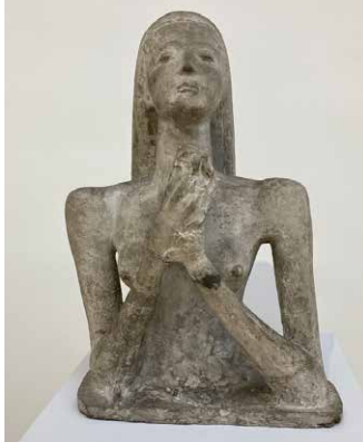
«Betende», Wilhelm Lehmbruck