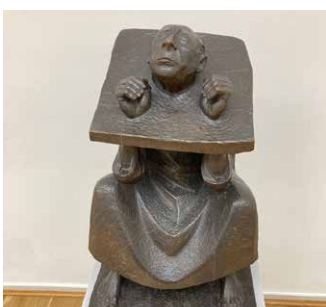
«Der Mann im Stock», Ernst Barlach