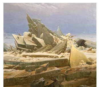
«Das Eismeer», C.D. Friedrich