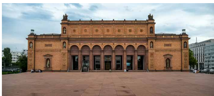
Besuche in der Kunsthalle Hamburg bilden einen Schwerpunkt unserer Reise