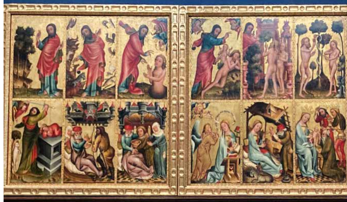
Grabower Altar, Bertram von Minden (Ausschnitt)