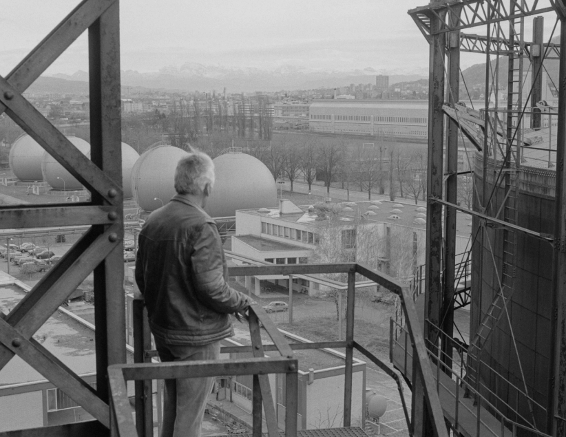
Gaswerk, Schlieren, Werner Friedli 1950, e-pics.ethz.ch