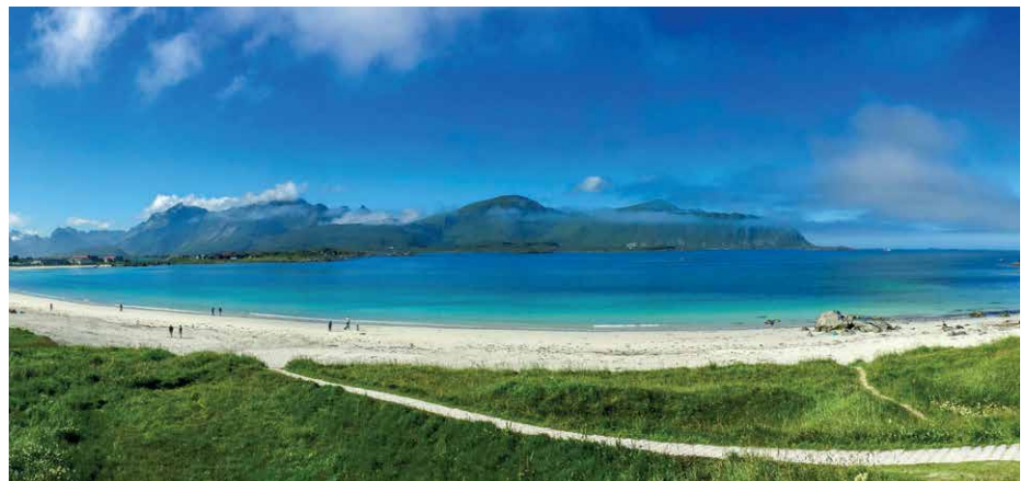
Rambergstranda auf den Lofoten

Auf einer Panoramafahrt Richtung Fjordland begleiten und überqueren wir das mystisch anmutende Dovrefjell, seit jeher magischer Anziehungspunkt für Skifahrer und Künstler. In Ringebu beginnt farbenfroh unser «Stabkirchen-Special»! Ganz anders die Kirche von Lom am reissenden Fluss: Brauntöne, viel Licht und ein so nie gesehener Herr Jesus! 1 Übernachtung in Lom.