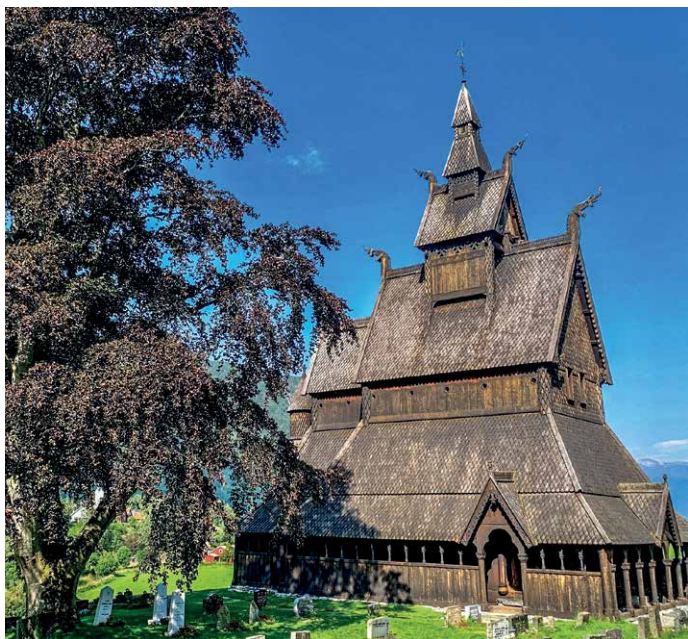
Die Stabkirche in Hopperstad