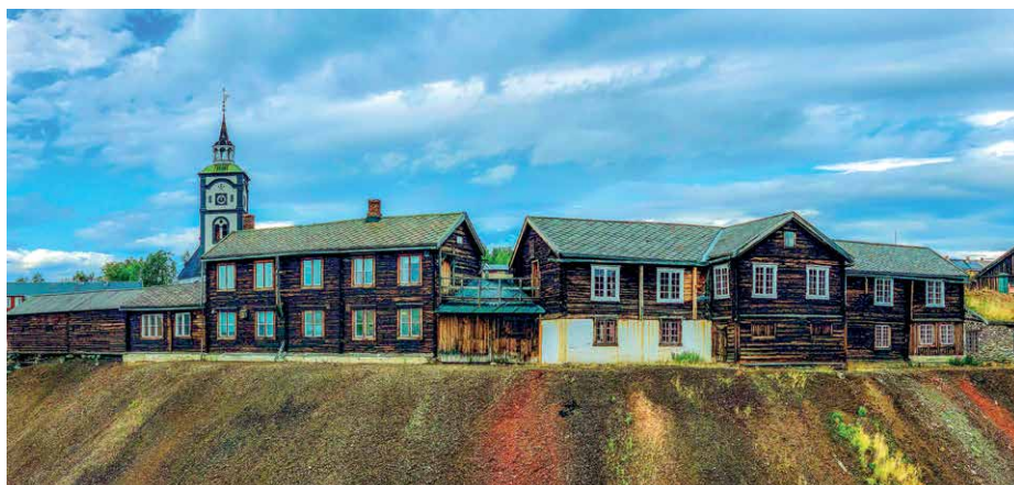
Aussicht auf Røros