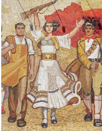
Mosaik in Tirana