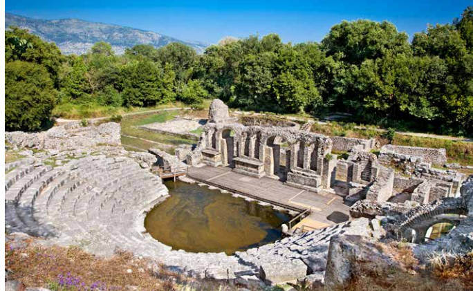
Amphitheater in Butrint