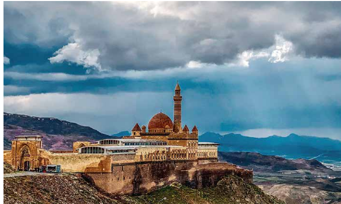
Spektakulär gelegen: Ishak Pasha Palast