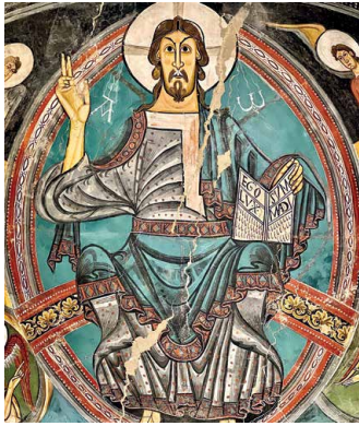
Im katalanischen Nationalmuseum