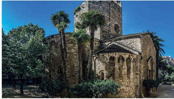
San Pau del Camp, Barcelona