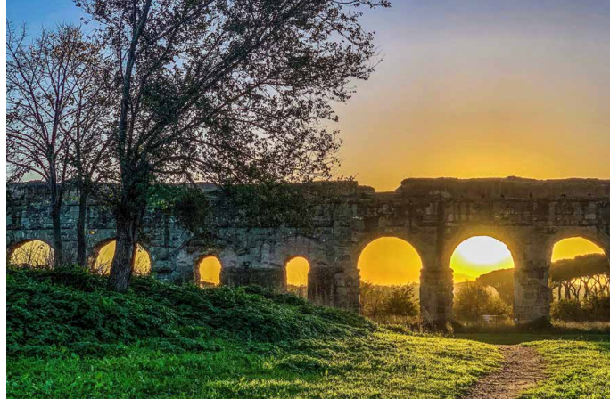
Im Parco degli Acuedotti